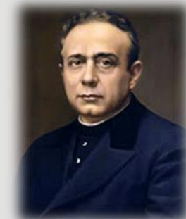
San Pedro Poveda