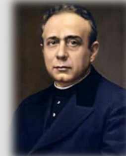
San Pedro Poveda

La familia es el lugar privilegiado de transmisión de valores, de criterios, de aprendizaje afectivo, de capacitación para las relaciones interpersonales. Al plantear la educación escolar hay que tener presente en el proyecto educativo las competencias de los padres en la educación de sus hijos/as.